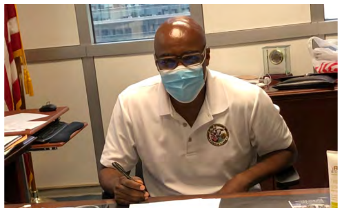
El procurador general Raoul regresa al trabajo después de recuperarse del COVID-19 en 2020. El Buró de Derechos Laborales ofreció orientación y ayuda a los trabajadores y empleadores que buscaron asistencia para cumplir con la guía de seguridad estatal y federal.

Durante la pandemia de COVID-19, el Buró de Derechos Laborales lanzó una línea telefónica directa y un buzón de correo electrónico para los constituyentes que tuvieran preocupaciones de seguridad en el lugar de trabajo en relación con COVID-19. Desde que estos recursos fueron hechos disponibles, los abogados y el personal de la Procuraduría contactaron a cientos de empleadores en un esfuerzo por lograr que cumplieran las órdenes ejecutivas del Gobernador y la orientación de seguridad estatal relacionada con la pandemia.