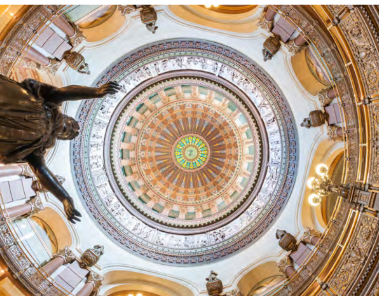
En la foto, la cúpula del Capitolio del estado de Illinois, vista desde el centro del primer piso de la rotonda. El Capitolio del estado de Illinois hospeda a la asamblea general de Illinois, la cual aprobó el Proyecto de Ley 672 del Senado para enmendar el Acta de Libertad para Trabajar de Illinois.

Del mismo modo, las empresas entran en acuerdos de “no contratación de trabajadores de la competencia” para evitar que su competencia contraten a sus trabajadores. Estos acuerdos a veces se utilizan en la industria de empleo temporal, donde el objetivo es reprimir los salarios de los trabajadores e impedir la competencia entre agencias. Para los trabajadores con salarios bajos, los acuerdos de no contratación de los trabajadores de la competencia pueden tener un efecto devastador en su capacidad de mejorar sus circunstancias de empleo al conseguir otro trabajo.